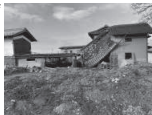
屋根が落ちた家屋

要があり、重労働でした。また、土壁を壊し土嚢袋にガラを入れる作業は、土埃が舞い上がる中での作業で大変でした。