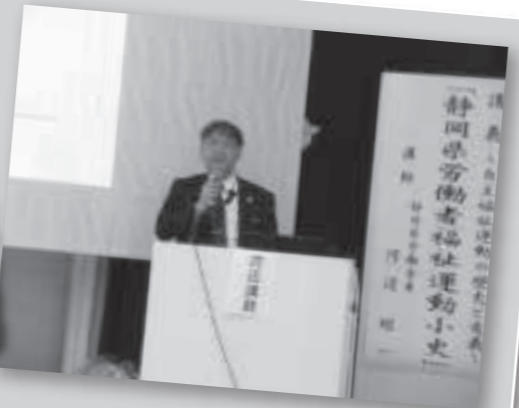
西部：ろうきん河辺統括長

その後の分散会では、参加者がテーブルを囲んで意見交換を行い、今後の活動に活かせること、出来ることなどを確認しあいました。「他労組の人と情報交換でき有意義でした」「まずは自分がろうきんやこくみん共済coop<全労済>の商品を使ってみて、仲間にも知らせたい」「労働組合運動の歴史的経過を知ることができた」などの感想が多く寄せられました。