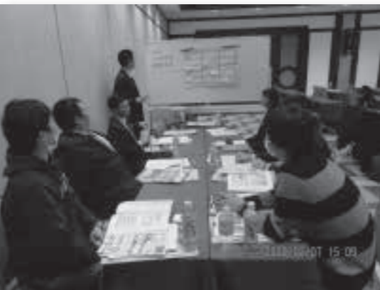
＜分散会・ワークショップの様子＞

その後の分散会では、参加者がテーブルを囲んで意見交換を行い、今後の活動に活かせること、出来ることなどを確認しあいました。「他労組の人と情報交換でき有意義でした」「まずは自分がろうきんやこくみん共済coop<全労済>の商品を使ってみて、仲間にも知らせたい」「労働組合運動の歴史的経過を知ることができた」などの感想が多く寄せられました。