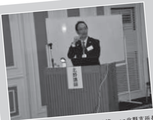
中部：こくみん共済coop北野支所長