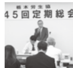
第四五回定期総会