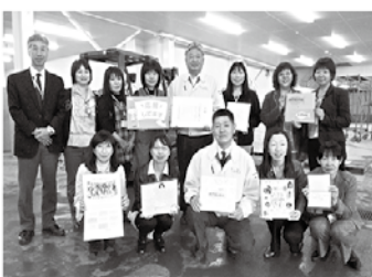
被災したお取引先に支援金を贈呈

生協は人と人が「助け合い・支えあい・分かち合う」集まりです。組合員・消費者の皆さんのお力をお寄せいただき、被災地の一日も早い復興に向けて全力をあげていきます。