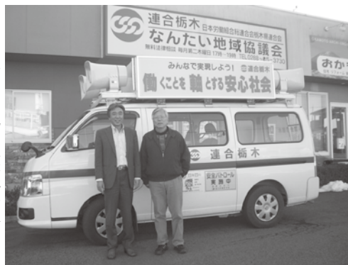
なんたい地協事務所前

連合栃木「なんでも相談 ダイヤル」の街頭宣伝活動 に曾部事務局長と二回同行 「左の写真」する等、今後 も勤労者福祉運動への理解 を広めつつ、男体山の如く ドッシリ構え頼れる存在へ 引き続きご支援願います。