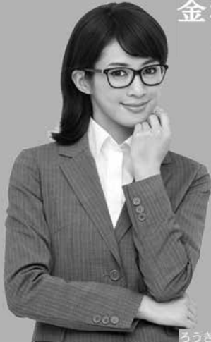
ろうきんイメージモデル 高垣 麗子