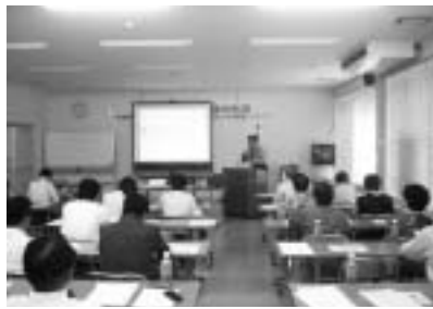
わーくびあ徳島502号室

もある。」「定年後は仕事をせず生きていけないのか?」など行政に期待と不安を寄せる意見があ