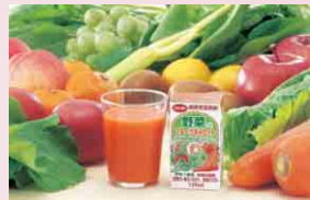
・野菜のフルーツキャロット