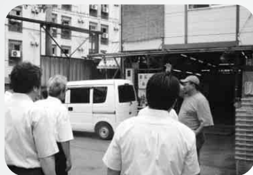
JOBカフェ OSAKA (写真左)