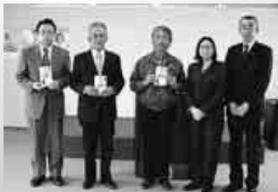
上：寄付金授与式 右下：倉吉支店にて 左下：米子支店にて