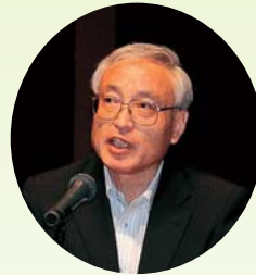
松軒理事長 あいさつ

議案書に基づいて5つの議案が提案され、参加総代223名(実出席87名、代理人出席6名、書面出席130名)により採決が行われ、すべての議案が賛成多数により可決されました。