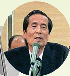
山上組合長 あいさつ

来賓はじめ、総代、役職員324名が出席し、提案された2つの報告と8つの議案が圧倒的多数で可決承認されました。