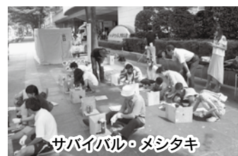
サバイバル・メシタキ

「命と仲間の大切さ」をテーマに、みんなの心がほかほかにあたたまりました。子どもと一緒に大人も楽しめるコンサートでした♪♪♪