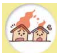
類焼損害保障特約