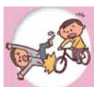
個人賠償責任共済