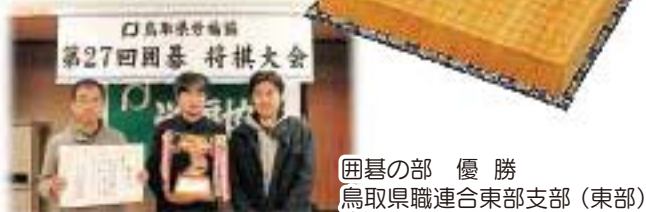
囲碁の部 優 勝 鳥取県職連合東部支部(東部)