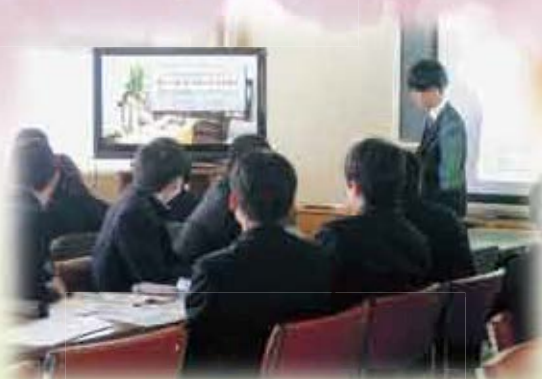
鳥取城北高校にて