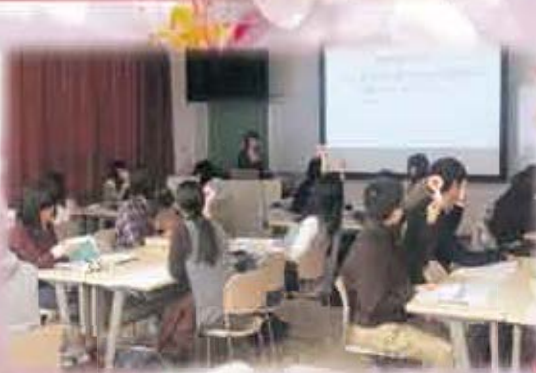
鳥取短期大学にて