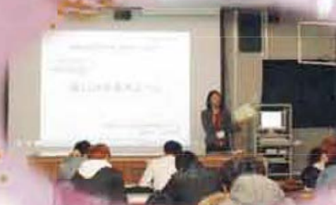
米子工業高等専門学校にて