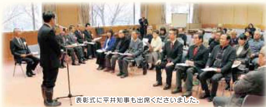
表彰式に平井知事も出席くださいました。