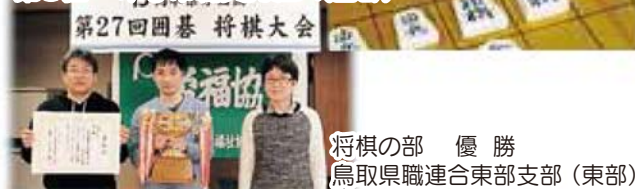
将棋の部 優 勝 鳥取県職連合東部支部(東部)