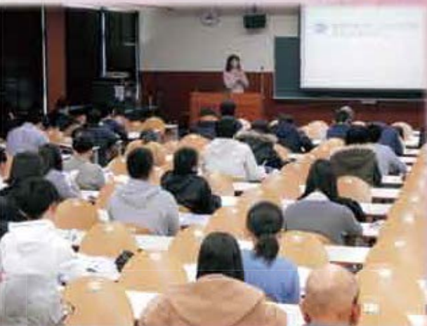
鳥取短期大学にて