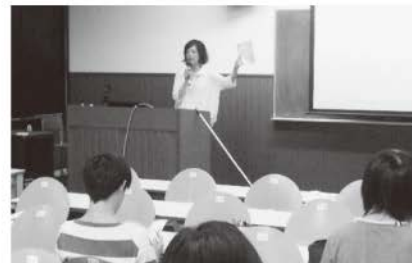
米子工業高等専門学校