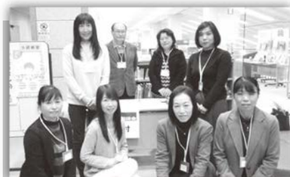
鳥取会場の参加者

こころの相談会の必要性を感じる中で、産業カウンセラーの質の向上が求められています。自分の能力を知り、支援ではなく、相談者がまだ気づいていない感情や物事の捉え方に気づけるよう、寄り添っていくことのできるカウンセリングを目指していきたいと思っています。今後も仲間とともに自己研さんしていきたいと感じています。