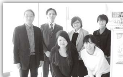
米子会場の参加者