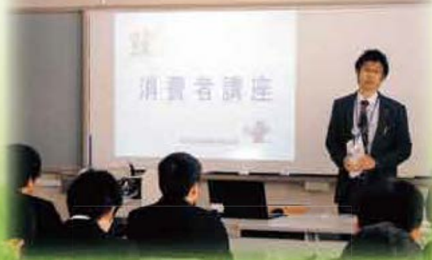
鳥取緑風高校にて