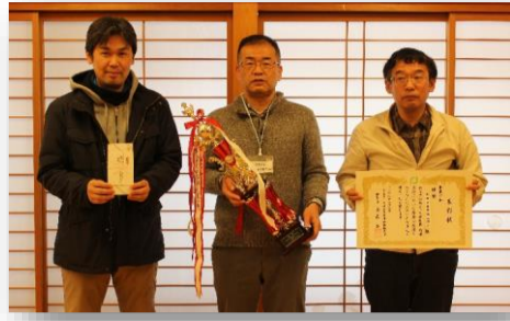
囲碁の部 優勝 鳥取県職連合東部支部A(東部)