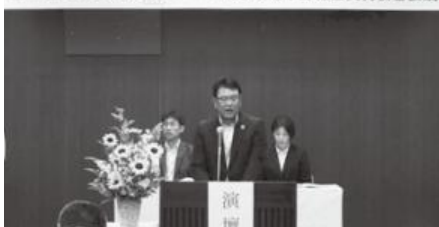
第67回鳥取県共済生活協同組合通常総代会 第2回こくみん共済coop<全労済>鳥取推進本部組合員代表者会議

2019年7月29日(月)こくみん共済coop<全労済>鳥取推進本部5階大ホールにて通常総代会および代表者会議を開催しました。2018年度は、鳥取推進本部が全労済へ事業統合して20年を迎える節目の年度でした。労働者自主福祉運動の発展に寄与し、「運動の広がり」と「各種共済利用の拡大による共済の浸透」を意識した取り組みを進めてきました。