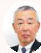
一般財団法人鳥取県労働者福祉協議会