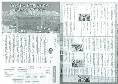
< 創立60周年記念誌 >

冒頭、辻 政光理事長の挨拶後、中央労福協 花井事務局長、富山県 荻布商工労働部次長、富山市 大場商工労働部長から祝辞を頂戴した。また中部労福協から北陸ブロック、東海ブロック、近畿ブロック代表者の出席を頂いた。