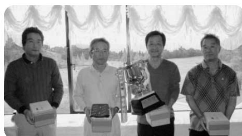
団体の部 優勝 東置賜地区の皆さん