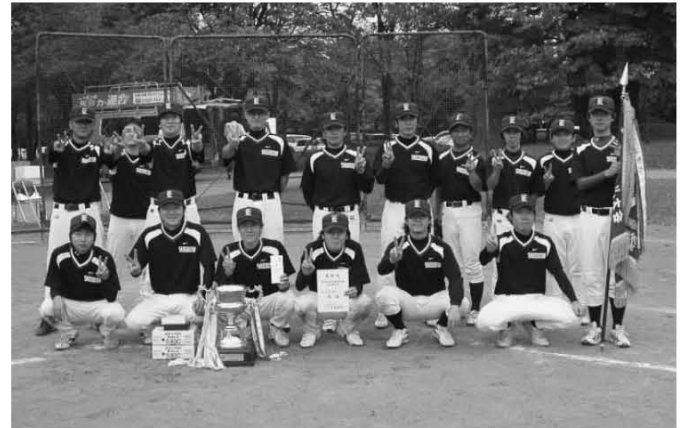
〈ソフトボール 優勝 東北エプソン A〉