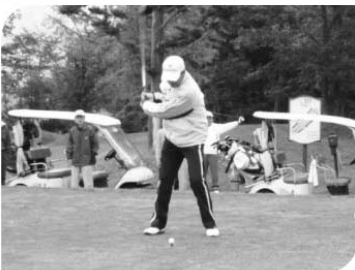
〈門脇労金県本部長による始球式〉

残暑厳しい日々から一転し、大会当日は涼しさを通り越し寒さを感じながらのプレーとなりましたが、昨年を上回る84名が参加し、各参加者が相互交流、親睦をはかれたと同時に、障害者の方々の社会参加や福祉施設の環境整備等のためのチャリティー金も集めることができました。なお、このチャリティー金は山形県ふれ愛募金会に寄附されます。