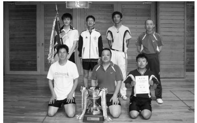
〈硬式卓球 優勝 東北電労〉