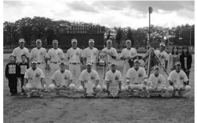
〈軟式野球 優勝 井上産業〉