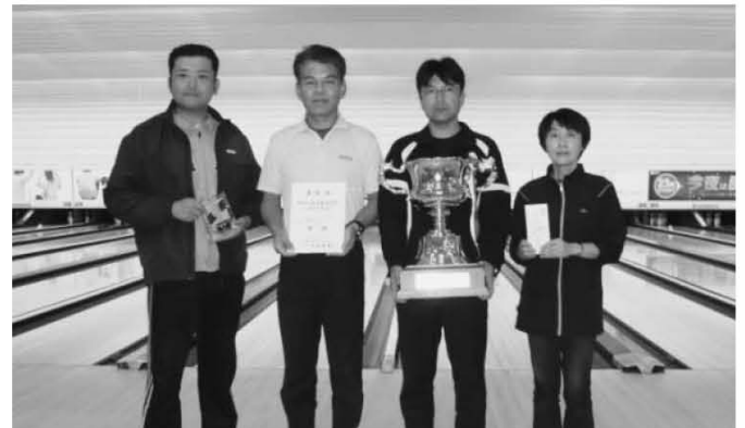
〈ボウリング 優勝 米沢市職労 Chops〉