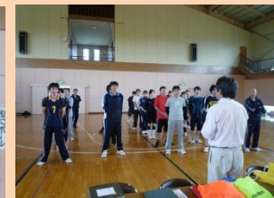
(優勝：C・H・SVC(酒田市職労))

今回から県大会競技種目となったソフトバレーボール競技。競技者の年代・性別の組み合わせは自由としています。酒田市勤労者体育センターで開催し、庄内2地区から3チームずつが参加し、総当りのリーグ戦で熱戦を繰り広げました。初代優勝チームには飽海地区代表の酒田市職労が輝きました。