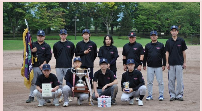
(優勝：置賜総合病院労働組長井病院分会)