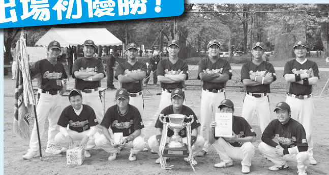
【優勝 センチュリー21(株)クリエイイト礼文】