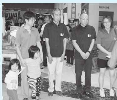
【優勝 酒田市役所 A】