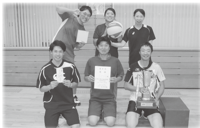
優勝 酒田市職労チーム