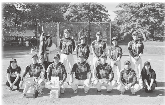
優勝 J A 庄内みどりチーム