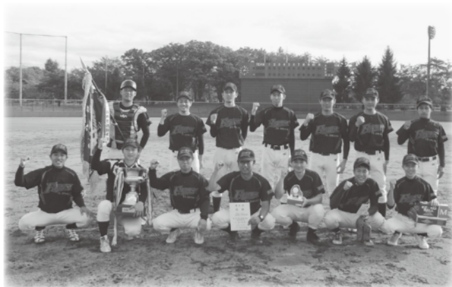
優勝 酒田地区広域行政組合消防本部チーム