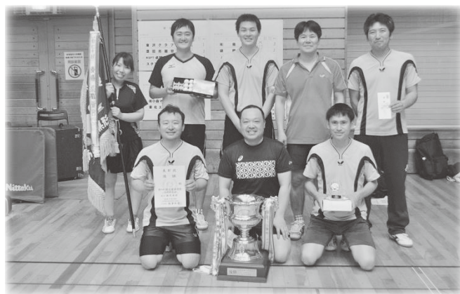
優勝 東北電労チーム