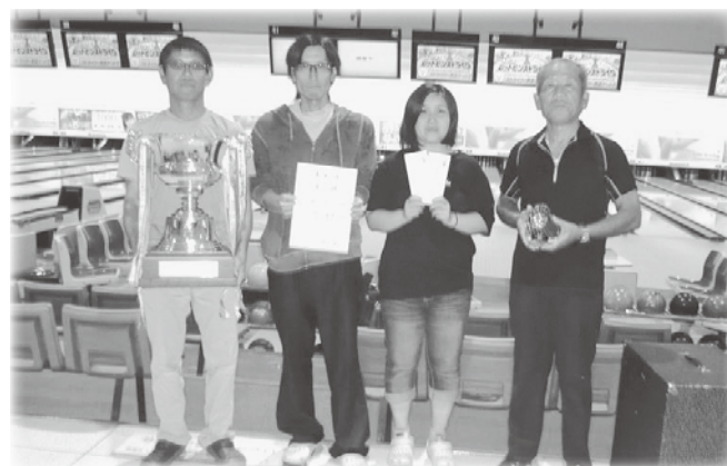
優勝 第一貨物チーム