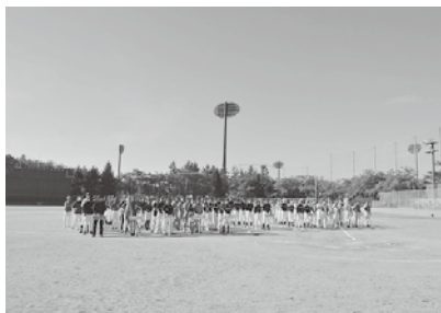
晴天の10/6開会式の様子

第71回勤労者体育祭山形県大会を9～10月にかけて県総合運動公園を主会場に開催しました。4～9月に開催した地区予選には合計256チームから2,239名が参加し、勝ち上がった計59チーム、501名が県大会に出場しました。競技種目は5競技で、9月24日に硬式卓球、ソフトバレーボールを、10月6日に軟式野球、ソフトボール、ボウリング、10月13日に軟式野球の準決勝・決勝をそれぞれ行いました。