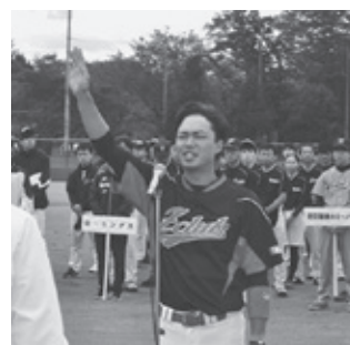
選手宣誓をする軟式野球JP労組酒田支部清水主将