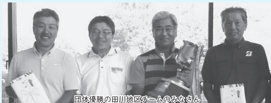
団体優勝の田川地区チームのみなさん