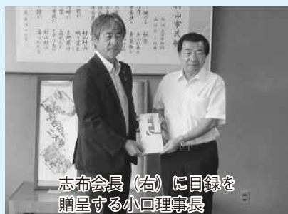
志布会長(右)に目録を 贈呈する小口理事長

8月20日、埼玉県労福協より「労組・事業団体から集まったタオル500枚をボランティア活動に役立てて欲しい」とのご支援を頂きました。心より感謝申し上げます。