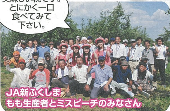
JA新ふくしまもも生産者とミスピーチのみなさん