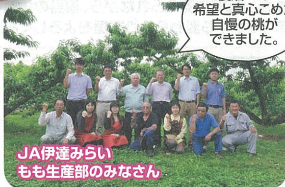
JA伊達みらいもも生産部のみなさん