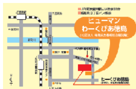
JR 徳島駅から歩いて20分、昭和町3丁目バス停前