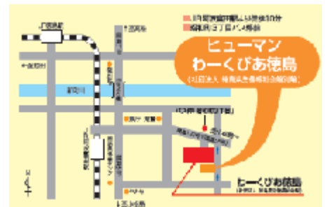
JR 徳島駅から歩いて 20 分 昭和町 3 丁目バス停前

ヒューマンわーくびあ徳島 4階 徳島市昭和町3丁目35-1 Tel.088-625-5111