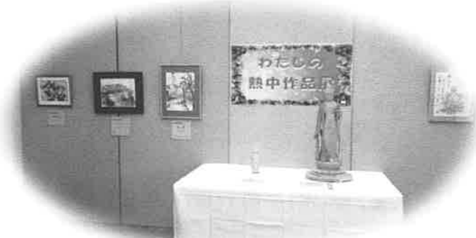
わたしの熱中作品展