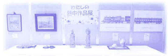
わたしの熱中作品展