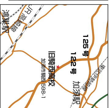
加須市「旧騎西高校」