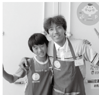
暑かったけどがんばりました

参加されたお子さんからは「疲れたけど楽しかった」「大人になったらお母さんの仕事のコープをやりたい」などの感想が、また、地域担当者（親）からは「組合員さんのあたたかな心遣いに触れられた」「親子で仕事が出来て、とても楽しく貴重な時間を過ごさせて頂きました」などの声が寄せられています。