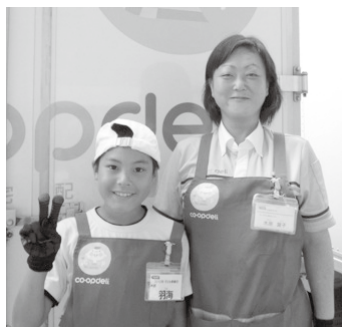
お母さんの役に立ったかな？

参加されたお子さんからは「疲れたけど楽しかった」「大人になったらお母さんの仕事のコープをやりたい」などの感想が、また、地域担当者（親）からは「組合員さんのあたたかな心遣いに触れられた」「親子で仕事が出来て、とても楽しく貴重な時間を過ごさせて頂きました」などの声が寄せられています。