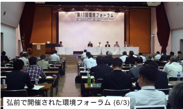
弘前で開催された環境フォーラム (6/3)

2011年の今年が国連「国際森林年」であることから、「森林整備」の必要性や意義をメインテーマとした。