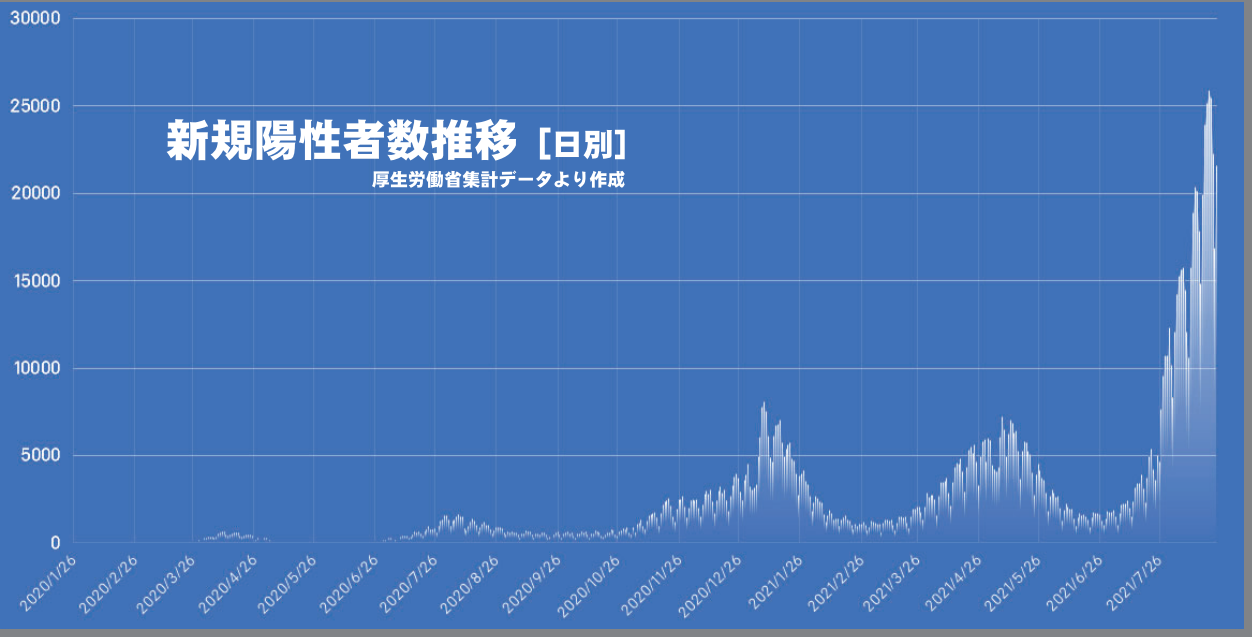
▲ 2020/01/26 ~ 2021/08/24 までの日別の新規陽性者数の推移。第5波ははまだピークが見えない。(2021/08/25 時点 厚生労働省データより作成)