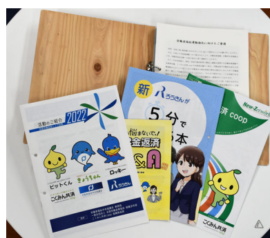
写真① 地球環境に配慮し、リングファイルは杉の間伐材を使用した製品とし、要請状にはバナナペーパーを使用した。