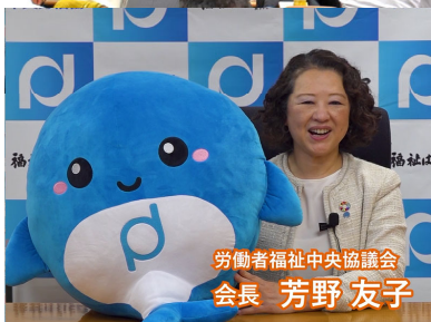
労働者福祉中央協議会 会長 芳野 友子 様