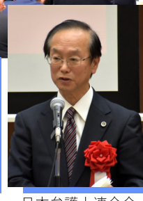
日本弁護士連合会 副会長 三木 秀夫 様