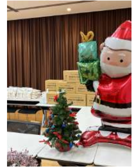
画像左 子どもたちが 食料品を受け取る様子