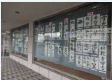
中国ろうきん鳥取支店