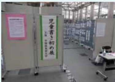
とりぎん文化会館

毎年多くの作品を出品していただく書き初め展は今年で41回目を迎え、149人の児童の力作が出品されました。作品の展示は約3週間にわたって、中国ろうきん鳥取支店、とりぎん文化会館、中電ふれあいホールの3か所で行い、多くの方に観ていただくことができました。作品は学校の課題となっている文字を書いたものもあれば、自分の目標や普段感じていることを文字にしたものなど様々で、各自の想いを半紙いっぱい表現しており、子どもたちの力強さを感じました。