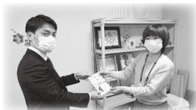
非営利活動法人就労支援B型事業所 「YSSだいせん」

西部支部は、12月24日、Xmasイブの日に「カンパ金」を特定非営利活動法人3施設に贈呈をしました。当日は、3施設とも理事長の出迎えをしていただき、突然のXmasプレゼントに驚かれ、感激、感謝をされました。施設もコロナ禍の中で、受託作業が減少し、通所者の皆さんの工賃も目減りしていることを聞き、「カンパ金」の贈呈とあわせ、施設の受託作業の提供と物販にも協力が必要だと強く感じました。