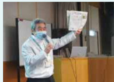
こくみん共済coop小野東部支所長

発行責任者 本川博孝 編集責任者 安部泰夫 編集委員 中島一彦・澤北和彦・山根美奈・横山美友・谷口美紀 発行日 二〇二二年三月 発行 鳥取市天神町三〇番地五 (二)財鳥取県労働者福祉協議会 第310号 TEL(〇八五七)二七四一八八