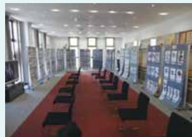
中電ふれあいホール