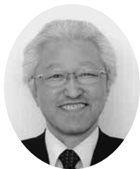
山形県生活協同組合連合会