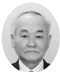
(一社) 山形県勤労者福祉センター

教育や労働を巡る環境は時とともに変遷していますが、設立の趣意書で謳う「有為な人材の育成と県内における就業の促進」を希求してまいりますので、本年も変わらぬご指導をお願い申し上げます。