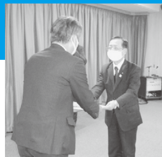
若松副知事に要望書を手交

その後、要望事項の中から「失業者・離職者への就労支援」をテーマに「離転職者がキャリアチェンジしやすいシステム作り」「移住者への転職支援の充実」などについて意見交換を行ったほか、「労金への冬のボーナス返済に関する相談傾向からみた労働者を取り巻く現況」「コロナ禍における県内の生活協同組合の現況」「医療従事者を取り巻く環境」「奨学金制度の拡充・改善」など幅広く報告・情報交換を行い閉会しました。