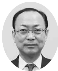
(公財) 山形県勤労者育成教育基金協会