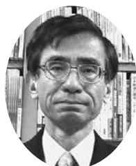
(一社) 山形県経済社会研究所

2021年が皆様にとりまして、素晴らしい一年となりますよう心からご祈念申し上げ、新春のご挨拶とさせていただきます。本年もよろしくお願いいたします。