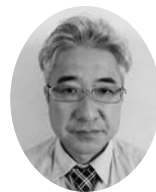
大隅地域労働協 会 長