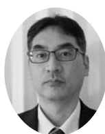
北薩地域労働福祉協議会 会長