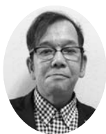
始良伊佐地域労福協 会 長