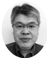
南薩地域労働協 会 長

か。退陣理由は単なる健康問題ではないのは周知のとおり。情勢は少しずつ、そして何かをきっかけにして突然大きく変化することは歴史が証明済み。今年は丑年、前へ前へ、みんなできばいもんぞ。