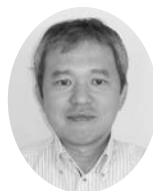
鹿児島地域労働協 会 長