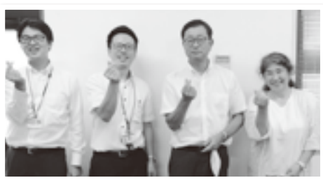
コープみやざき労組の役員の方々(右のお二人)

新型コロナウイルス感染拡大で先の見えない状況下にありますが、新しい営業のスタイルであるタブレット端末を活用した「オンライン営業」や、「Webアンケート」「Web完結型融資」等も駆使しながら、会員に寄り添い、「ろうきん」ならではの取り組みを実施していきますので、「労働者福祉みやざき」を愛読されている皆様にもご協力のほどよろしくお願いいたします。