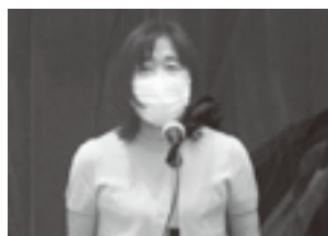
中川会長あいさつ