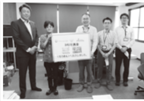
IHU社員会の方々(左のお二人)