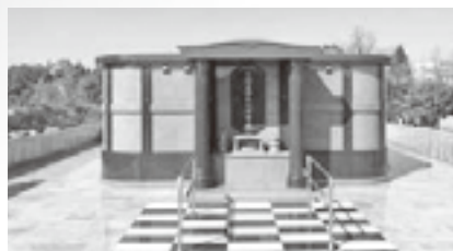
永代供養墓 (合葬墓)

永代供養墓には、骨壺を安置する合葬墓と、粉骨したご遺骨を合祀し、供養する合祀堂があります。また、正面には、お参りのための香炉、花立て等が設置されています。側面には墓碑銘プレートを設置する銘碑が設けられています。