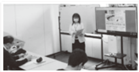
鉦脈社員会のセミナーで商品の説明をする長友職員の様子