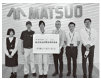
松尾宮崎社員共済会の方々(左の三人)