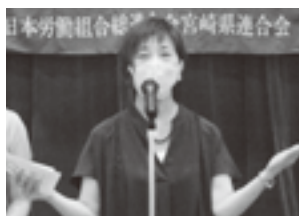
相馬副会長による一丁締め