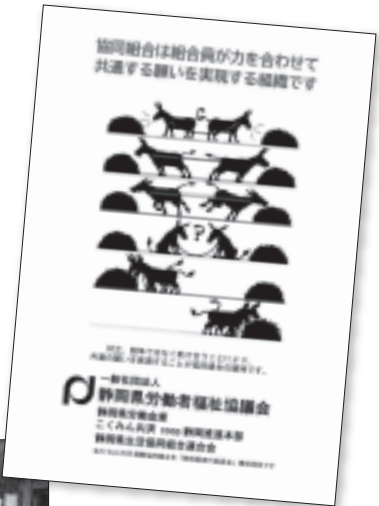
静岡県労福協作成 クリアファイル

※ … 17 か国語に翻訳、25 ヶ国で出版され、EC（後の EU）創設の影響を与えた