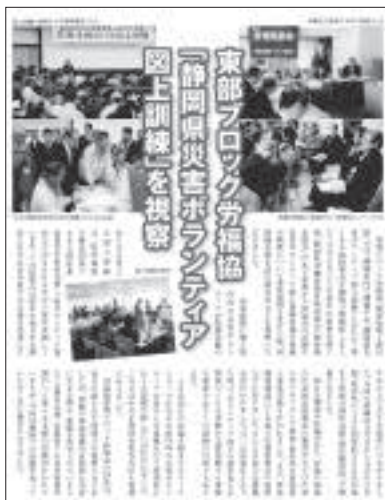
【労福協だより】2012年春号

対処方法を承知している人は、町内の中でも限られた人が限定的期間であることが多いと思います。突然災害が発生した時には、どうすれば良いか判断できない町内もあるのではないのでしょうか。近所との関係性の希薄化、高齢化が進む中では深刻な問題の要因と思われます。以前は福祉基金協会で「災害ボランティア訓練」や「災害ボランティアコーディネーター養成講座」の開催や運営協力をしていました。今にして思えば、修了して知り得た知識経験を地域の中で活かせるまでの仕組み作りがあればと思います。労福協活動の経験が今日的な社会課題である、地域の活性化や孤独孤立対策の一助にもなると思います。