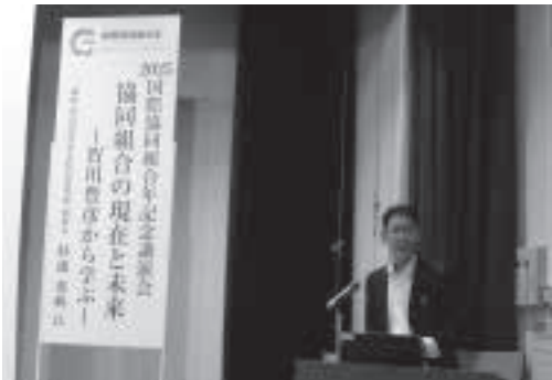
ミャンマー大地震募金とフードドライブを実施

労福協は、労働金庫、こくみん共済 coop、静岡県生協連はじめ、協同（組合）組織として活動しています。今後の活動の拡がりに向けての契機となりました。県内にある協同組合組織、静岡県農業協同組合中央会・静岡県森林組合・静岡県漁業協同組合などとともに 2025 国際協同組合年静岡県実行委員会として県内の「協同組合」の認知向上と振興の活動を展開しています。