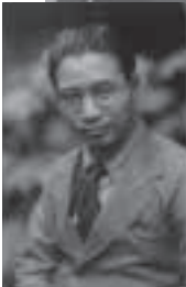
若き日の賀川豊彦