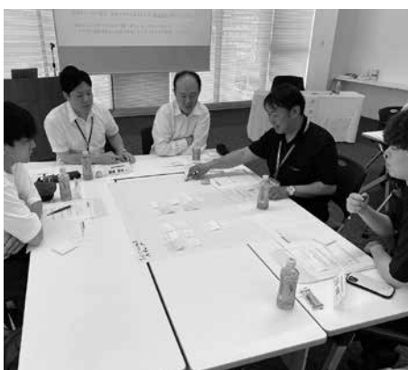
各グループにて熱心な討議がなされました