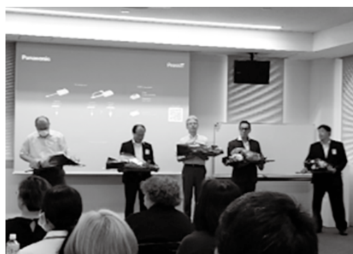
退任役員 感謝状贈呈