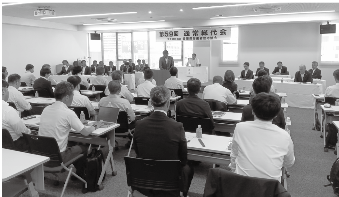
愛媛県労住協 第59回通常総代会