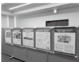
国際協同組合年 タペストリー展示