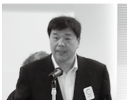
議案提案 本銅 貴重 専務理事