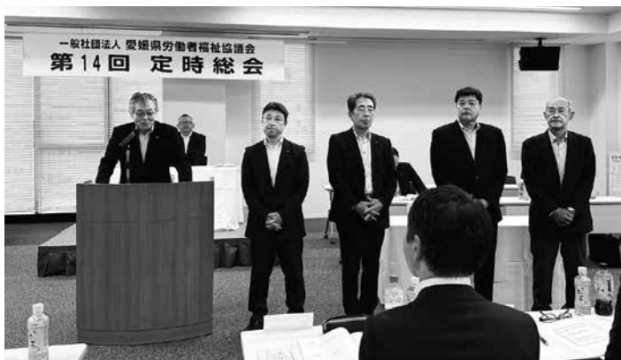
退任される役員の皆様 大変お世話になりました。

次に共益事業については、地域労福協、構成事業団体との連携・協同した取り組みや、中央・西部労福協での取り組みを紹介するとともに、労働者福祉事業団体連携促進事業については、愛媛県勤労会館の解体工事及び解体費用精算にかかる