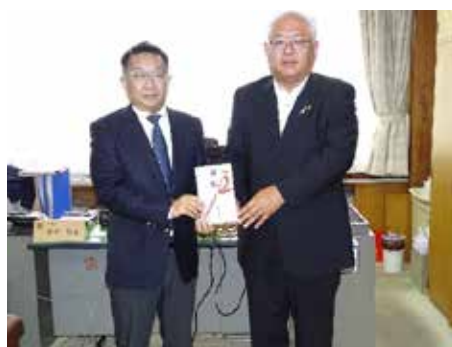
愛媛県庁にて、高岡教育長へ目録贈呈

愛媛地区は、「教育」分野として、愛媛県教育委員会へ 144,600 円を寄付することになり、2025 年 6 月 2 日に愛媛県庁にて、杉本理事長より高岡 哲也 愛媛県教育長に寄付金目録を贈呈しました。