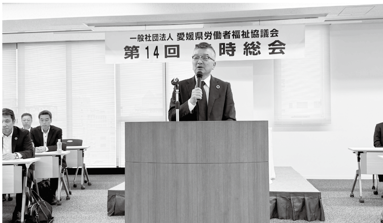
愛媛県労福協第14回定時総会