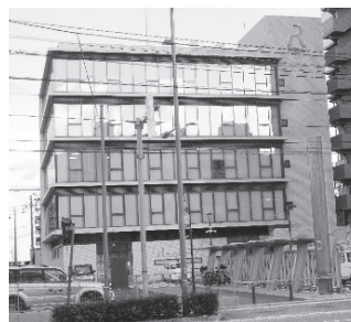
四国ろうきん松山ビル グランドオープン