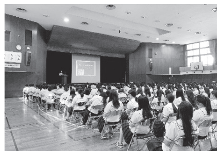
講師を担当いただいた皆様、ありがとうございました

●資料や画面を使って説明をしてくださったので、分かりやすかったです。特に契約はどのタイミングでされるのかというお話が印象的で契約をする前にしっかりと考えることの大切さを学びました。(高校生/女性)