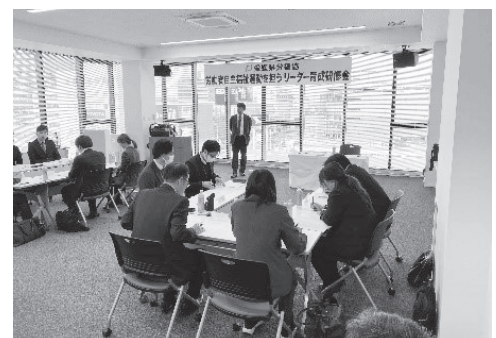
労働団体・事業団体合同で3班に分かれ、自主福祉運動の将来について議論