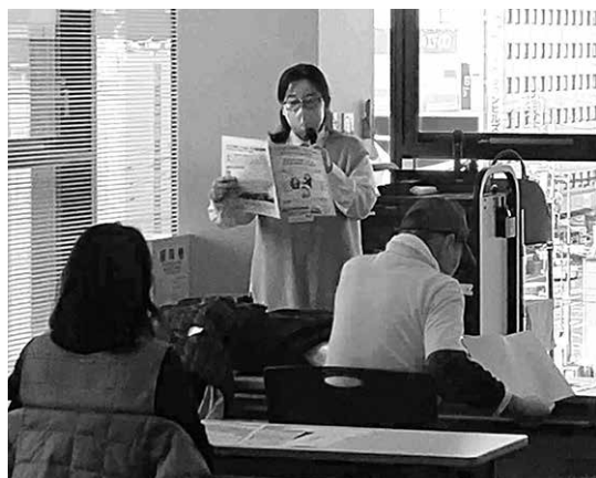
相談員よりジョブえひめの特徴についてお伝え

講師からは、「人間関係の悩みは誰しも一度は経験したことのある悩みで、特に職場においては、フルタイムであれば一日8時間、週5日、場合によっては家族よりも多い時間をともにするので、良い人間関係の職場で働きたいという思いは誰しもが持っている。ただ、仕事探しの際に自分の希望する条件に合う仕事・求人は選べても、一緒に働く人は職場に入ってみないと分からないし、選べない。自分の条件にあった仕事を、人間関係で無碍にすることがないように、職場で上手な人間関係をつくるコツを一緒に考えていきましょう。」とのお話があり、参加者はグループワークで過去の経験や、その時の対処法などを話し合いながら、気付きを得る時間を共有していきました。