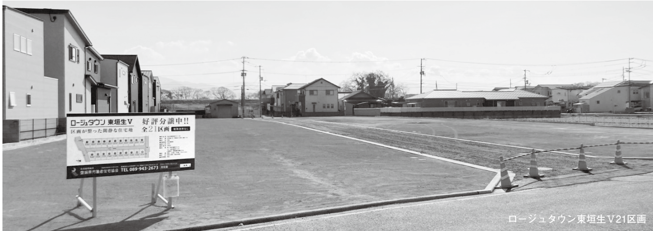
ロージータウン東垣生V21区画