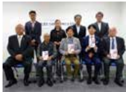
2024年度愛媛地区助成先団体の皆様

2002年度から、「助成金制度」を制定し、四国内で活動されているNPOやボランティア団体を対象に、助成金を贈り、地域の福祉活動を支援しています。 制度発足後23年間で、延べ565団体に総額9,237万円を贈呈しました。