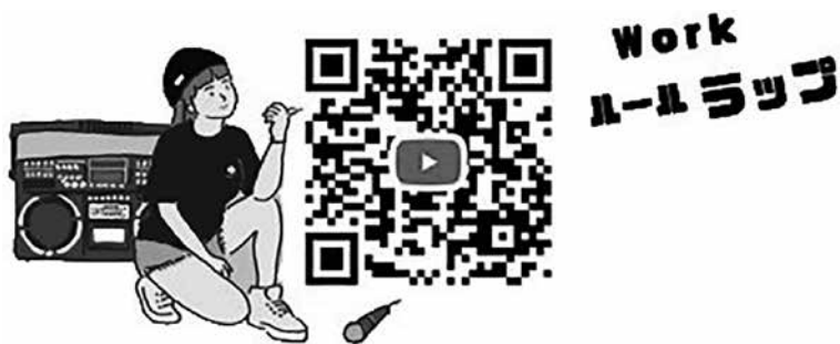
ワークルールラップも多くの方に視聴いただきました

これからアルバイトや働く際に気を付けることなど知らないところまで詳しく学べて良かったです。 (高校生/女性)