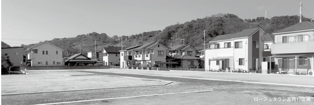
ロージータウン高岡17区画