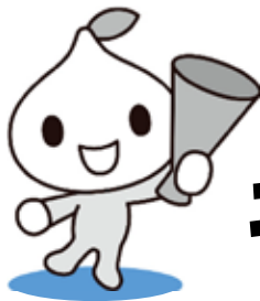
こくみん共済 coop 公式キャラクタービットくん