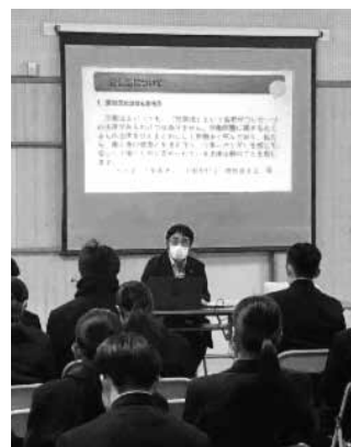
講師を担当いただいた皆様、ありがとうございました

大阪で就職したいと思っている。今日勉強したことを活かしたい。ニュースでよく聞く闇バイトには引っかけられないようにしたい。帰ってゆっくりハンドブックを見てみようと思いました。 (高校生/男性)