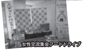
女性交流集会フードドライブ