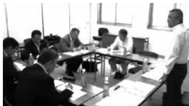
各地域拠点で行われた「地域拠点効果検証ヒヤリング」写真はヒヤリングを受ける沼津地域労福協役員

全国に例のない「地域役立資金」を誕生させてやれやれではなく、この資金の本来目的である「地域の自主福祉運動の前進に寄与しているのか?」を絶えず検証していく必要があります。2014 年には県内各地域拠点に於いて「地域拠点効果検証ヒヤリング」を実施し、それぞれの地域役員から地域・地区拠点の設置効果について聞き取りを実施しました。その時点ではどの拠点でも効果はまだこれからとの声が多かったと記憶しています。どうかこの素晴らしい「地域役立資金」の更なる有効活用と資金の維持継続に、多くの関係者のご尽力を頂きますようお願い申し上げます。