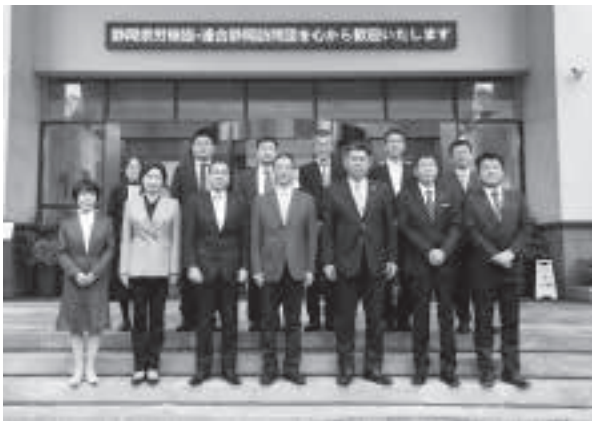
浙江省総工会代表团との集合写真

セキュリティ保障、スマートサービス提供を行い国家ハイテク企業と認定され、併設されている保育施設では、自分の子供と食事を一緒に過ごせるなど社員と家族の生活環境整備に力を入れていました。