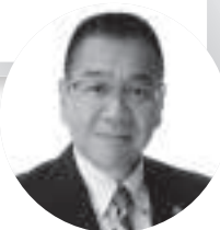
一般社団法人 静岡県労働者福祉協議会