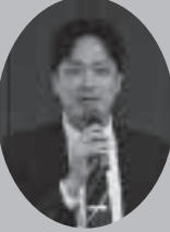
ステップアップコース 仁王講師