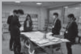
ステップアップコース グループワーク