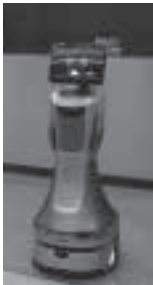
日本語で案内する自走ロボット