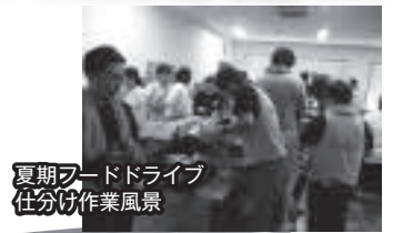
夏期フードドライブ 仕分け作業風景

厳しい状況となり、皆様のご協力が頼りとなります。引き続き、皆さまのご支援をいただけますよう、よろしくお願いいたします。