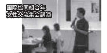
国際協同組合同年 女性交流集会講演