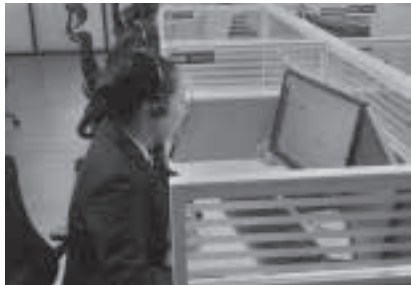
24 時間相談ホットライン

浙江省総工会に直属する労働者の権利保護と生活支援を核心とする公共サービス機関です。無料の法律相談、職業訓練、心理カウンセリングなどのサービスを提供し、労働者が直面する労働紛争や生活上困難の解決を支援しています。その役割は「静岡県福祉基金協会」と一部似ています。近年大きな成果を取めるのは 24 時間相談ホットラインのデジタルサービスで、問題解決の便利さと効率の高さが評価されています。自走するロボットが日本語で案内・施設紹介をしてくれました。