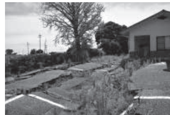
正院町公民館の駐車場は隆起がひどく今も手つかず