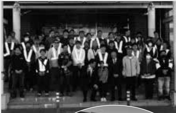
クリーンキャンペーン

社会貢献活動では、裾野市クリーンキャンペーンを実施し、各団体からも多くのボランティアの皆さんに協力していただき街の美化活動に積極的に関わっております。