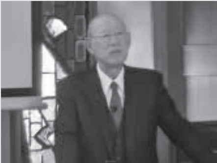
賀川記念館 講演 西講師

並んで「世界 3 大聖人」と称されている人物で、救貧・防貧、さらには日本における「協同組合の父」として助け合いの社会づくりに尽力された活動家です。こくみん共済 coop、生協、労働金庫などの協同組織設立の基礎を築き上げました。仕組み作りと実践がともなった功績を賀川記念館 西顧問から講演を受けました。