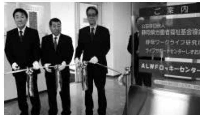
地域役立資金を活用して開設した「ALWF ロッカーセンター」開所式

他県から呼ばれて講演をする機会が何度か有り、講演の中でこの「地域役立資金」の創設について話をしましたが、静岡県労福協を中心としたまとまりの良さ、自主福祉運動の先進性を高く称賛する多くの声を聞くことが出来ました。