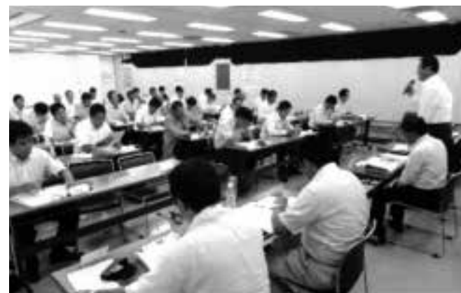
地域役立資金が県労福協理事会で承認され、その審議経過を幹事会で報告。多くの質問・意見が出されました。

地域役立資金（30億円）の原資となる特別利用配当金の再拠出は、言葉では簡単ですが各労働組合は利用配当金を年間の労組予算に組み込み定期大会で承認を受けて活動しています。再拠出に当たっては各機関会議で討議をし、改めて定期大会に掛け承認を得るなど相当な労力が必要でした。「創設の意義は理解できるが資金が枯渇したらどうする?」「資金が無くなったら拠点は廃止するのか?」など心配する意見が多数出され、説得するろうきん各支店の運営委員長、支店長はかなりの苦労がありました。しかし、各地区での熱心な説明のおかげで最終的にはどの地区からも多くの賛同を取り付けることが出来、安堵すると共に資金管理団体と