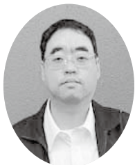
阿久根市職員労働組合 執行委員長

本年も皆様にとって良い年になりますようご祈念申し上げ、新年のご挨拶とさせていただきます。