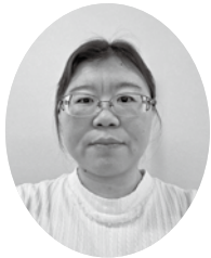
九州労働金庫霧島支店 青年・女性推進委員会 幹事

本年も皆さまにとりまして飛躍の年となりますようご祈念申し上げ、新年のご挨拶とさせていただきます。「風は南から」、共に頑張りましょう！