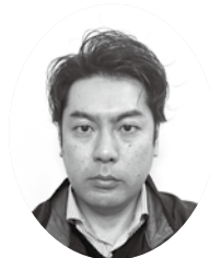
ナンチク労働組合 執行委員長

最後に、今年1年が、皆様にとって健康で実り多き1年になりますよう御祈念申し上げて新年の挨拶とさせていただきます。