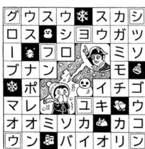
答え フユシヨウグン (冬将軍)