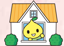
こくみん共済 coop 公式キャラクター ビットくん