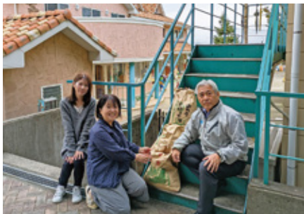
児童養護施設(光の園)