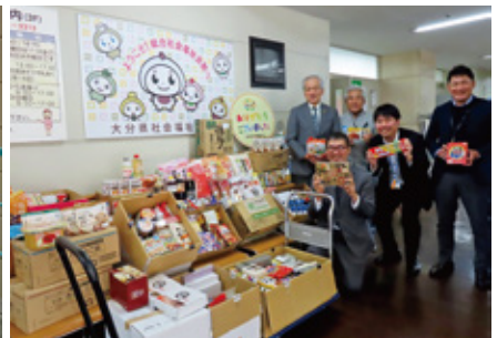
フードバンク大分

労働相談 生活相談 法律相談 福祉・医療相談 消費生活相談 一人て悩まない、あきらめない、まずは相談を!