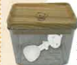
キャニスター& 計量スプーン セット