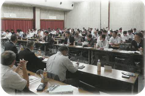
熱心に聞き入る代議員