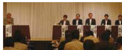
▲パネルディスカッション

国際協同組合年の目的は、「協同組合の社会的認知度を高め発展させること」にあり、本研究集会において労福協に結集する協同組合の社会的役割や価値について改めて考察する中で、その目的に向けたそれぞれの課題や取り組み内容を確認しました。