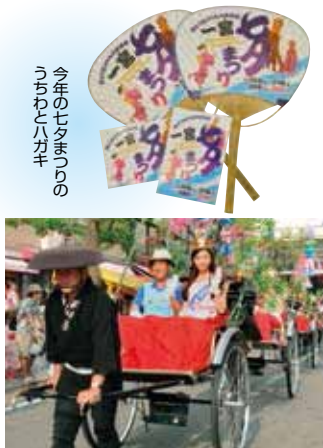
ミスの「人力車七夕道中」の風景。