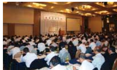
▲研究集会会場の様子