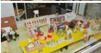
「ちゃらん家」は日替わりシェフが腕をふるうほか、ここ「ほんまちサンプラザ」の中にある1坪月3,000円で出店できるBOXショップで手作り雑貨も販売している(左上)。