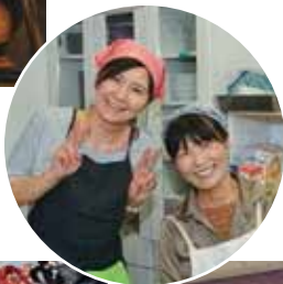
「ちゃらん家」の筋向いにある「まちこん一宮」のオフィス。イベントの企画・運営で活躍する縁の下での力持的存在。