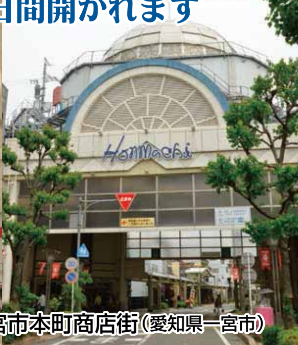
一宮市本町商店街(愛知県一宮市)