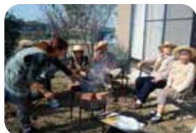
▲庭でバーベキューを囲むデイサービスのお年寄りたち。外での食事は楽しそう。