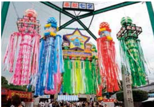
仙台・平塚の七夕まつりとならび、飾り付けの絢爛豪華さは内外の観光客から日本の三大七夕まつりと称される。