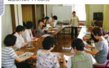
▲実務スタッフたちの打ち合せ。頼れるベテランがさらに現場で次代のメンバーを育てていく。