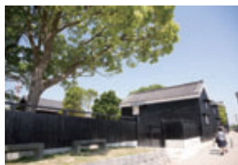
運河沿いの半六邸東側。土蔵・石垣・黒板塀・差し掛かる大きな木が独特の風情を醸し出す。