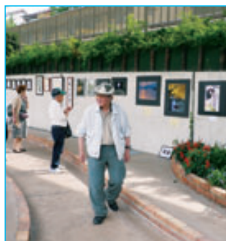
会員が自慢の作品を持ち寄るアート展。散歩道の壁が素敵なギャラリーになる。