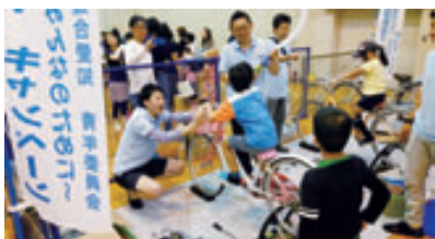
自転車をこいでラジオを聞こう

地球環境を取り巻く課題を、未来を担う子どもを含め、一人でも多くの県民に知らせることを目的として始まり、本年度で7回目となります。