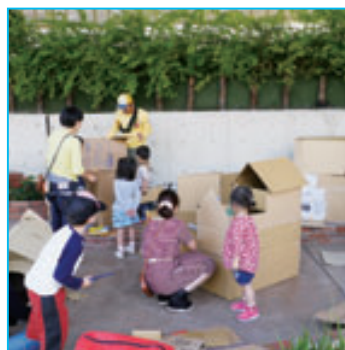
ダンボールの家を作るワークショップ。子供たちが家を担いで帰ったと話題に。