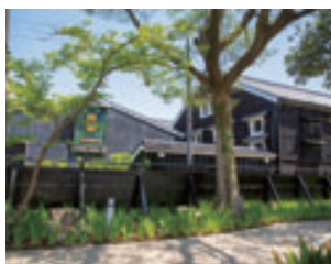
庭園からはお隣の「国盛・酒の文化館」の建物が間近に見える。