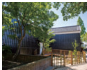
土蔵を改造して作られた豪華なトイレ。シャワートイレでバリアフリーも万全。

※ 2 口以上、寄付をいただいた方のお名前はホームページ、ニュースレターに掲載させていただきます。20 口以上寄付をいただいた方のお名前は、11 月に完成する半六邸内に設置するプレートに掲載させていただきます。