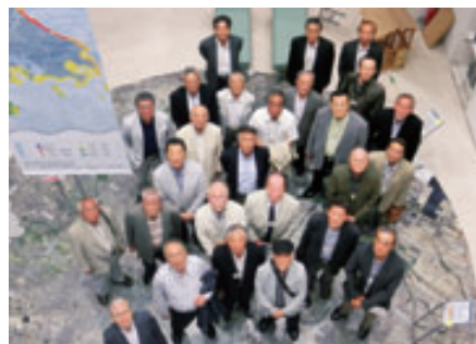
名古屋大学減災館

午前中には名古屋市博物館において、江戸時代に浮世絵を中心に巻き起こった猫ブームをテーマにした特別展を見学し、午後からは減災の最先端が終結する名古屋大学の減災館を見学しました。