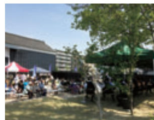
4 月、イベントでの緑陰コンサート。土蔵跡の石垣がステージに。