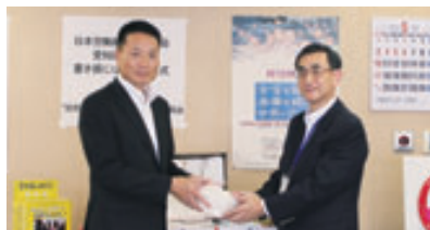
書き損じはがきを贈呈する土肥会長