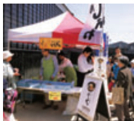
イベントで出店の「お豆腐工房 いしかわ」。ここがテナント第 1 号。