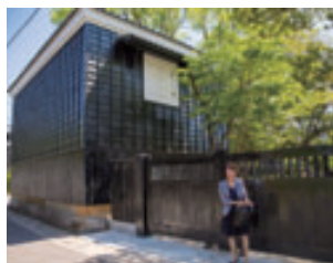
半六邸の西側にある土蔵と正面玄関。実際には土蔵は漆喰の白壁だった。