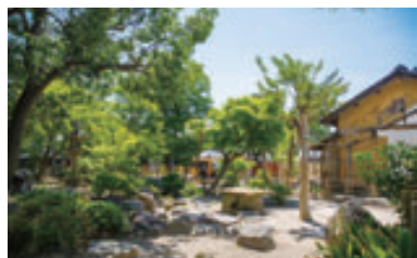
運河の潮位に連動していたという池のある日本庭園。写真中央に新たに作られた東屋が見える。