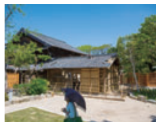
敷地の南側の広場側から母屋とクド（炊事場）を臨む。改修工事が着々と進んでいる。