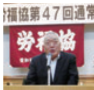
狗飼会長退任あいさつ