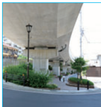
ヘアピンカーブを回り込むと、無機質な風景が緑と赤レンガの風景に一変する。

そこから、高架の道路の工事と歩道を合わせるように、地域住人と、名古屋市の行政とコーディネーター企業の三者で2年かけてプランを練って行く。さらには、名古屋市立大学の芸術工学部の研究室も加わり、地域と行政と大学のコラボレーションでビジョンづくりはいっしょに具体化していく。特に散歩道の設計には大学の