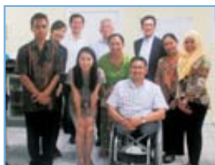
インドネシアでは社会省 (障がい者福祉の省) の担当者も理事に加わった。