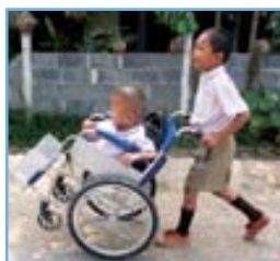
タイ東北部で出会った子ども達は、障がいのあるクラスメートを友だちみんんで支えて応援している。

ハードとしての車いすとソフト面での安定した支援と人と人との交流。地理、言語、文化の違いはあれ、車いすに託す思いはこの先も変わらない。