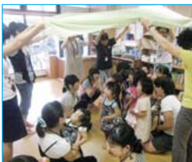
「大風来い親子教室」。ここにはもう二人ぼっちはいない。母子みんなの笑顔があふれる。