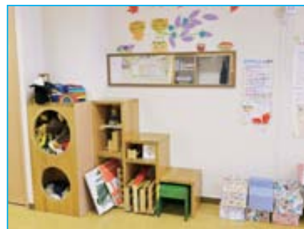
筋力がついた赤ちゃんは階段を登り、鏡と出会う。そこでママと違う自分の姿を見、自我と社会性に目覚める。

「遊モア」を開設して、13年。今では最初期にここで育った子どもたちがボランティアで来る。やがてはその子たちもお父さん・お母さんになり、さらに「まめっこ」の活動を拡げていってくれることだろう。