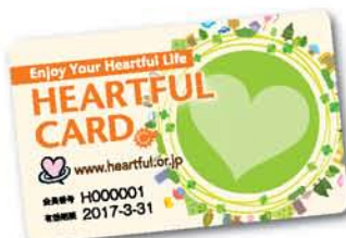
▲新年度ハートフルカード

ハートフルセンターでは、2016年度も勤労者の「安心・快適・充実ライフ」のお手伝いとして、ハートフルカード会員を募集します。各団体へ配布のチラシをご覧いただき、ぜひこの機会に1人でも多くの方がご加入いただきますよう、ご案内いたします。