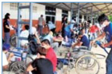
障がい児の家族・先生のほか、デンソーの現地社員が多数参加した車いす修理キャラバン。