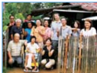
年 1 回、日本から奨学生を訪ねるツアーも実施。直接会っての応援は喜ばれる。