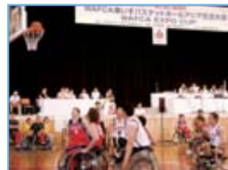
2005 年愛・地球博では、WAFA 主催で、車いすバスケットボールの交流試合も行われた。