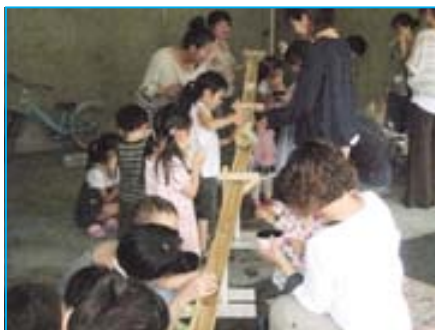
本物の竹を使った流しそうめんをやってみた。みかんやキュウリ、トマトも流れおとな子どももみんな大はしゃぎ。