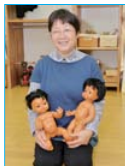
「カナダのお人形にはちゃんと性差が表現されてるんですよ」。