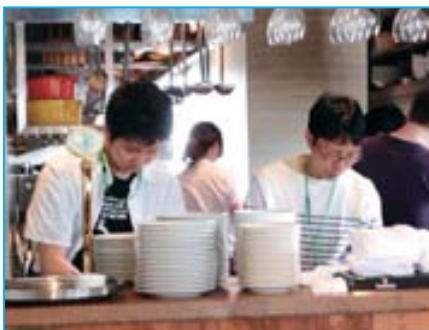
レストランを借りきって、ママと子どものために「パパが料理を作る「家族の絆レストラン」」は毎回大盛況。