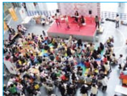
ロフト名古屋でのアトリウムコンサート。椅子席ではなく、床に座れるようマットを敷きたくさんの親子で楽しんだ。