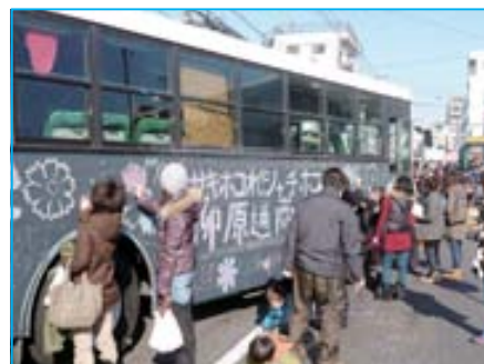
書いてくれた人を使って名城公園を一周二周した落書きバス。「冬に外で落書きのお祭りなんて」と反対していた商店街の理事さんも落書きを楽しんだ。