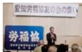
▲開会あいさつの三木会長