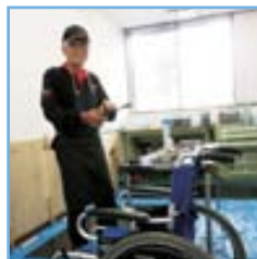
日本でも「車いす病院」を開設。2015 年には修理累計 1,000 台を超えた。