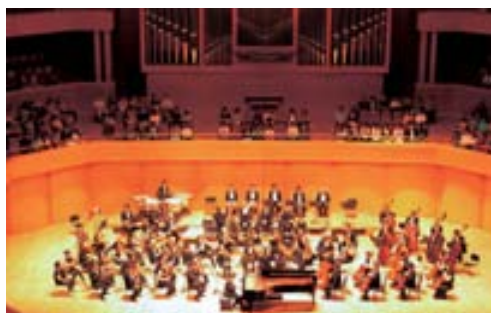
名古屋フィルハーモニー交響楽団の演奏