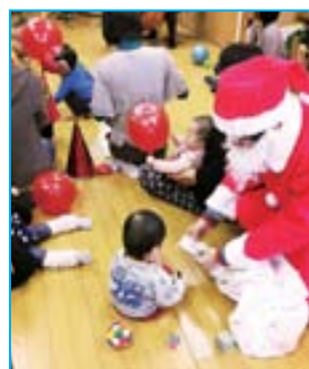
「遊モア」での昨年のクリスマス会。室内楽のライブ演奏も行われた。

その後、フランスやカナダでの子育て施設の視察を経て、2003年には「0～3歳とおとなの広場『遊モア』」を経済産業省の空き店舗活用事業として開設することに。