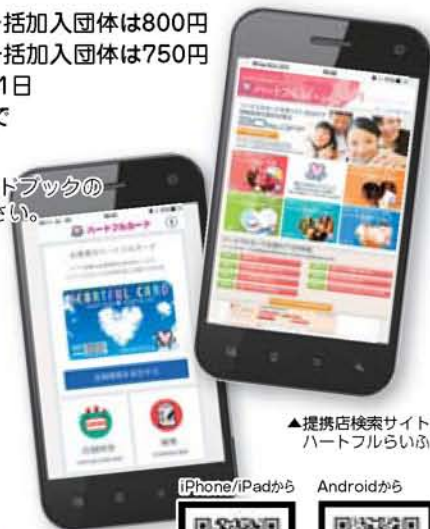
▲提携店検索サイト ハートフルらいい