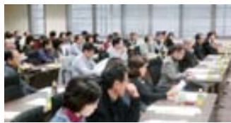
▲熱心に聴講する参加者のみなさん

毎回参加者をお願いしていますアンケートでは、具体的に判りやすい説明を聴くことができ、今までの不明な点が理解できた事や参考になった事など、大多数の方がセミナーに参加して「よかった」と答えられました。