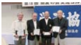
▲団体優勝の豊川地区チーム