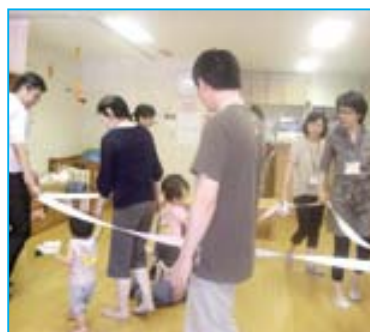
みんなの子どもたち、みんなのお父さん・お母さんでいっしょに遊ぶ電車ごっこ。