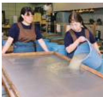
和紙工芸館に働く職員の皆さんは研修指導と合わせて自身の技術の研鑽に余念がない。この日はお二人の職員の方が畳一畳ほどもある障子紙を丹念に漉いておられた。