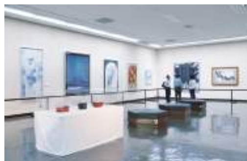
現代作家の小原美術工芸和紙による大作が並び和紙展示館の第3展示室。日本画のようなものや立体感を活かしたものもある。