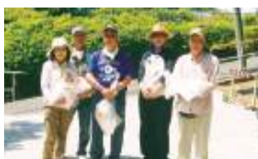
団体優勝の知多支部東海地区友の会チーム