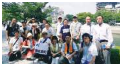
広島の平和行動に参加したみなさん

戦後71年を迎え「恒久平和の実現に向けて核兵器廃絶への新たな一歩を」をテーマに掲げて実施されました。