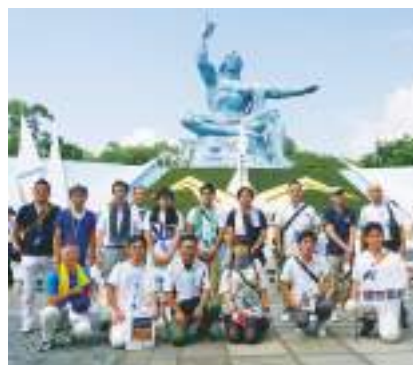
長崎の平和行動に参加したみなさん

平和祈念式典終了後、連合長崎青年・女性委員会のピースガイドによる連合2016 PEACE WALKに参加しました。