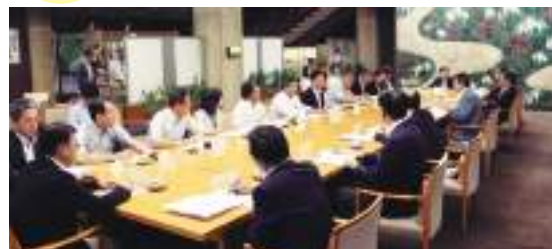
愛知県への要請行動 意見交換の様子

連合愛知は行政に対して、勤労者・生活者の立場に立った政策を反映させることを目的に、毎年「重点要望書」を策定しています。2016年度は、7月26日に愛知県、愛知労働局に対して、それぞれ重点要望書を提出しました。