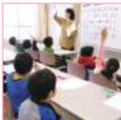
就学前の年少の子供たちにはプレスクールの授業がある。