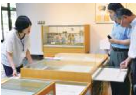
色んな産地の和紙が揃えられている和紙の標本コーナー（現在入替中）