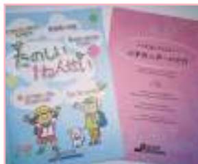
小学校入学のための手引。実際にはトルシーダがきめ細かくサポートする。