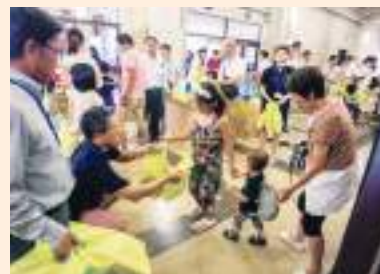
子供さんへ記念品