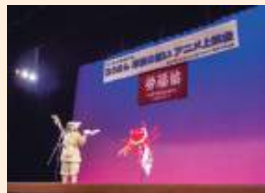
ミルキーちゃんの歌とバルーンショー