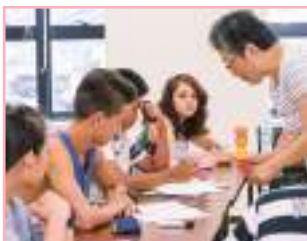
日本語の活用形を会話で学ぶ高校生たち。「どう？よく考えて答えてみてね」。