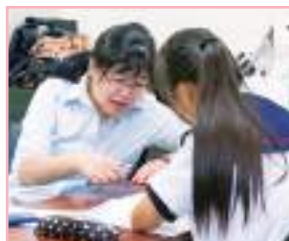
教科科目別の学習はマンツーマンで。数学を個人教授するボランティアの先生。