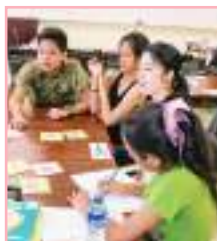
日本の大学生のボランティアも研修の一環で参加していた。