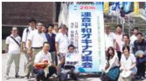
沖縄の平和行動に参加したみなさん

式典では、戦争の悲惨さや恒久平和を訴える一人語り部から、広島へとつなぐピースリレーや平和アピールを確認しました。2日目は、ピースフィールドワークでひめゆりの塔や糸数アブチラガマなど見学と慰霊を行った後、沖縄県庁前県民広場で開