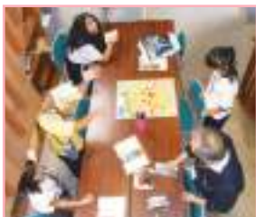
日本の文化への理解を深めるために古民家を訪ねての体験学習も行う。