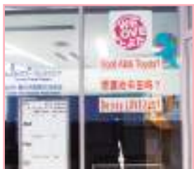
とよたグローバルスクエアのすぐ横の会議室が駅前教室。会議室入口の案内板も多言語対応。